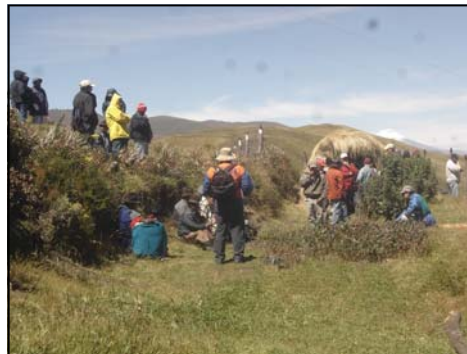
Invitados observan los trabajos de forestación realizados en la comunidad de Chumillos Alto.

2.000 hombres y mujeres de las comunidades de Chumillos Alto, Gualimburo y La Chimba de las parroquias de Cangahua y Ayora se beneficiarán del programa de forestación.