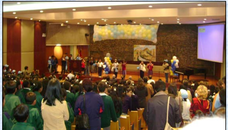
Participación de los niños niñas en el Salón de la Ciudad

La Asamblea General de las Naciones Unidas declaró al 22 de marzo como el Día Mundial del Agua, en conformidad con las recomendaciones de la Conferencia de las Naciones Unidas sobre Medio Ambiente y Desarrollo contenidas en la Agenda 21.