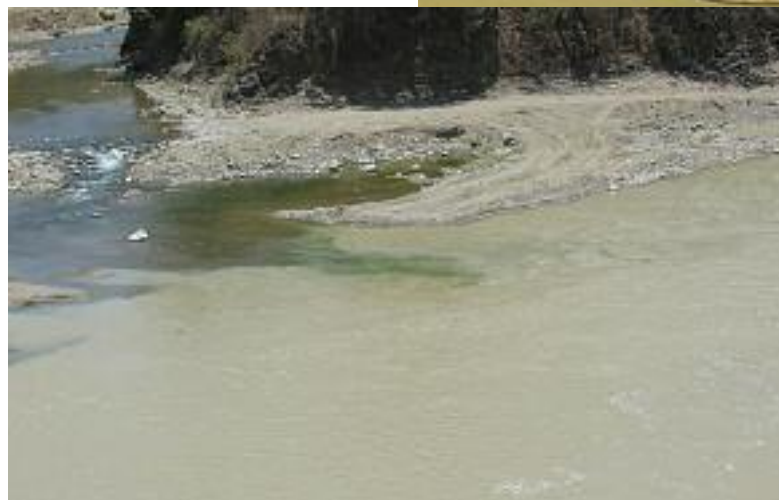
El uso de mercurio y cianuro contaminan gravemente los recursos hídricos. El río Catamayo, localizado entre las provincias de El Oro y Loja, es una muestra. En la foto se diferencia el agua contaminada del Catamayo y el agua cristalina del afluente.

pecuarias; vapores y emanaciones al aire; aumento de enfermedades respiratorias, intestinales, dermatológicas, renales; además de otras mortales como cáncer pulmonar y leucemia, enfermedad que ha causado algunas muertes y que estarían relacionadas con las actividades mineras, informaciones que oportunamente recogieron los periódicos "Hoy" de Quito y "El Nacional" de Machala.