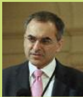
Asesor especial y Jefe de la Iniciativa sobre Economía Ecológica del PNUMA

Otro ejemplo de América Latina, que consta en el informe, es el Fondo para la Protección del Agua (FONAG) del Distrito Metropolitano de Quito, que es un mecanismo de financiamiento sostenible que permite la protección a largo plazo de los ecosistemas naturales y la prestación de importantes servicios eco sistémicos. La cuenca