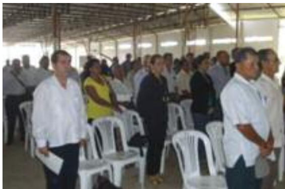
Asistentes al evento