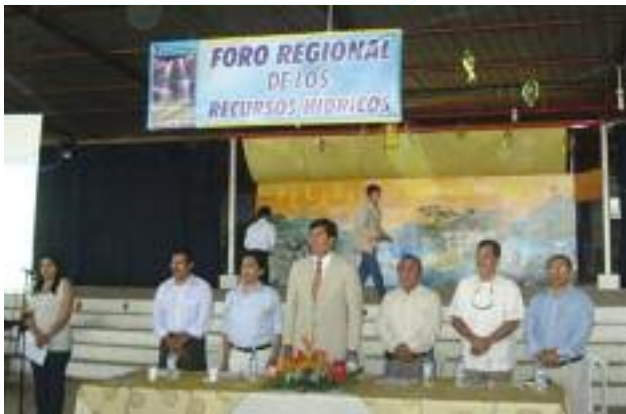
Autoridades y técnicos que participaron en el Primer Foro Regional de los Recursos Hídricos. Entre otros, el Subdirector del INAR, Alcalde de Pasaje, entre otros.