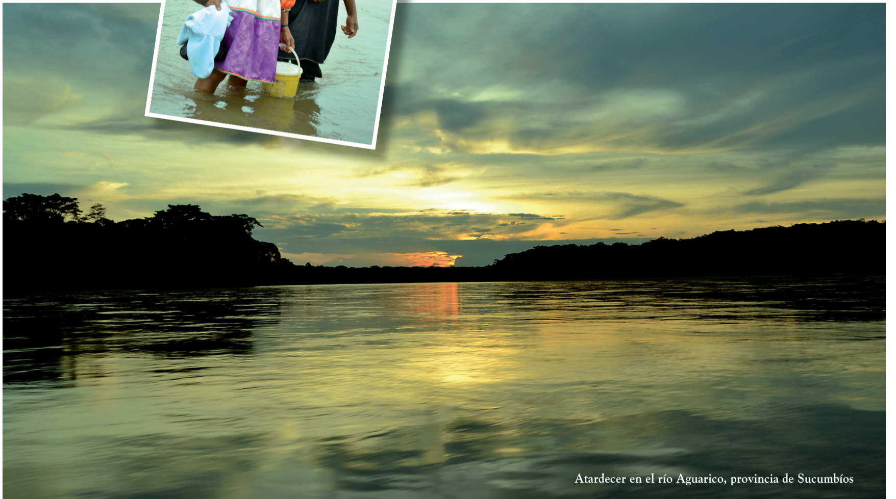
Atardecer en el río Aguarico, provincia de Sucumbíos