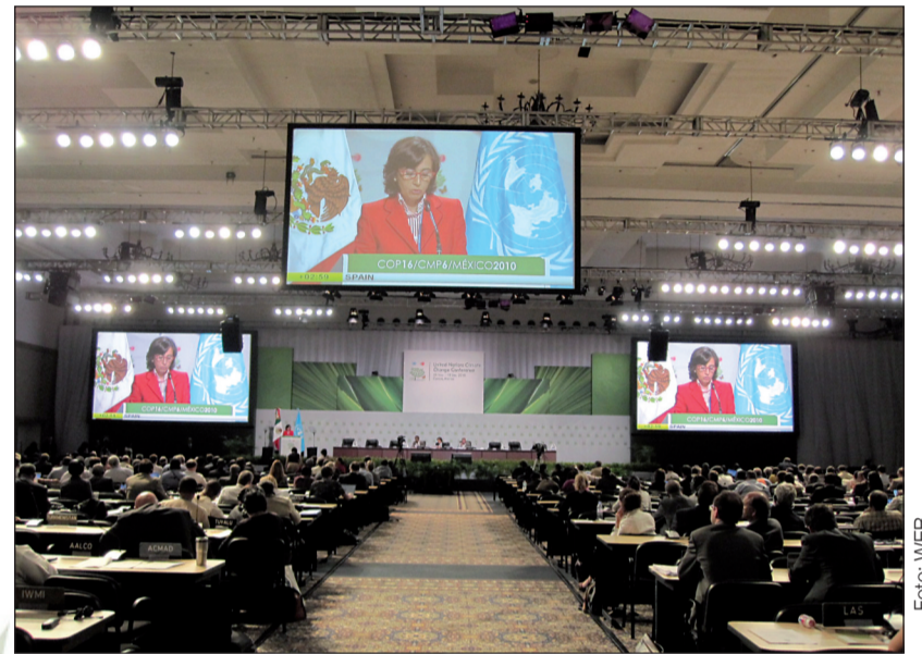
Cancún durante la COP16

El ritmo de degradación sigue su curso y las poblaciones de los países del Sur, donde se concentra el 90% de la biodiversidad del planeta, son las más amenazadas por este deterioro. El 30% de los anfibios, el 12% de las aves y el 22% de cada mamífero está en vías de extinción de