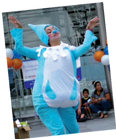
"Gotita gotero y los guardianes del agua", obra de teatro