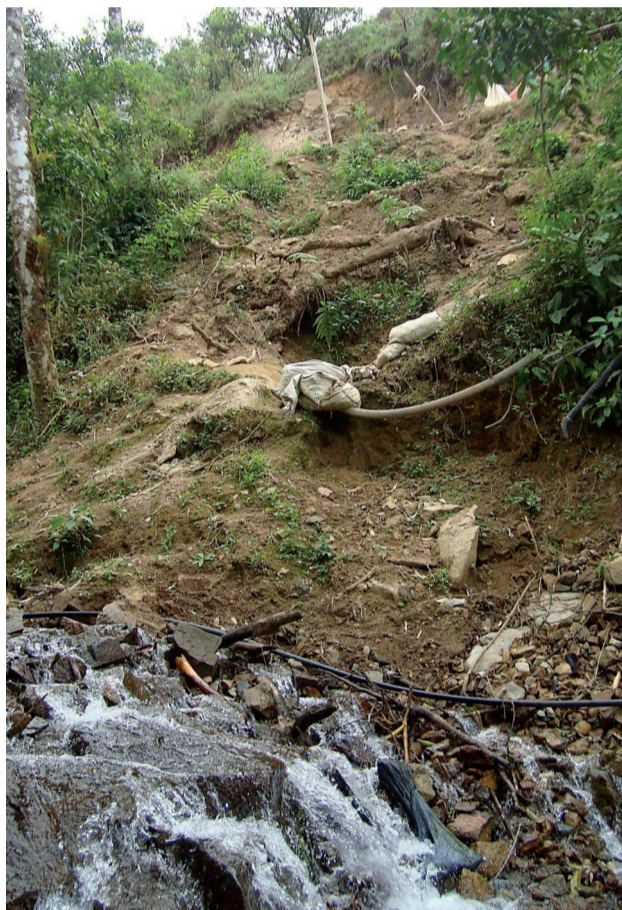
Afluente del río Luis contaminado por las actividades mineras, cuyos residuos descargan en este pequeño riachuelo.

Lo aseverado por los concejales fue ratificado por un delegado de la Agencia Desconcentrada de Regulación y Control Minero de Machala y funcionarios del Ministerio de Minas, del Departamento del Medio Ambiente de Portovelo, la Jefa Política, y el Inspector de Salud de Portovelo, quienes ratifican la necesidad de declarar en emergencia la zona para evitar la contaminación hídrica.