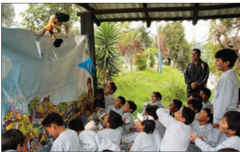
Los títeres como herramienta de sensibilización

El taller buscó insumos para elaborar los términos de referencia que permitirá contratar una consultoría que se encargue del diseño del "Corredor biológico de los paramos orientales del DMQ".