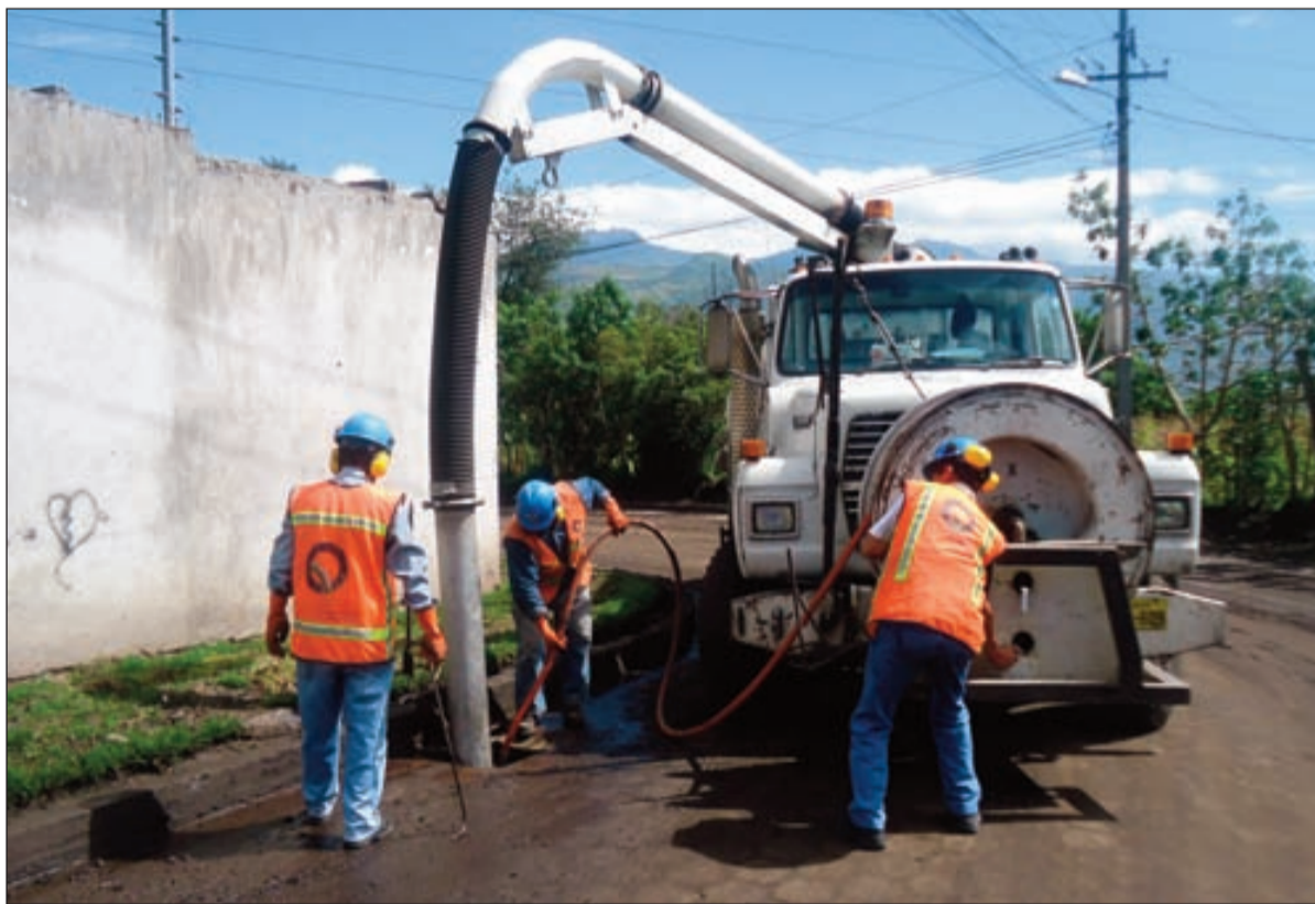
Equipos de trabajadores de la EPMAPS realizan la limpieza de sumideros en diversos lugares de la urbe.

En cuanto a las obras para prevenir inundaciones, en 2012 se concluyeron y están operativos: el nuevo colector Pomasquí de la cuenca de la quebrada Jerusalén, las obras hidráulicas quebrada Rio Grande, el túnel de alivio Colector Caicedo y mejoramiento de la captación, y el colector de la quebrada Capulí. Estas obras demandaron una inversión de USD 7' 200 000.