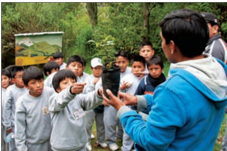
Los niños y niñas conocen la importancia de proteger los bosques