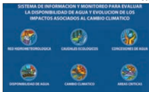
Servicios que presta el sistema.

El desarrollo y mejoramiento del sistema contó con el apoyo del Banco Interamericano de Desarrollo (BID), la Agencia de los Estados Unidos para el Desarrollo Internacional (USAID), Environmental Systems Research Institute (ESRI) y el Banco Mundial (BM) a través del Ministerio de Ambiente del Ecuador (MAE).