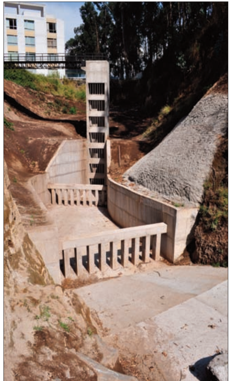
Varios colectores se construyeron para prevenir inundaciones.