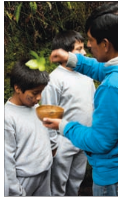
Ceremonia de graduación

Lo que hace sólo siete años era un basurero, ahora es un parque y reserva ecológica donde se encuentran 22 ojos de agua. Un yaktuk , que en quichua significa joven que