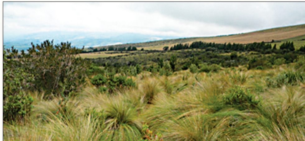
Restauración con plantación de polylepis, año 2005. Hacienda José Miranda en Pintag.

La captura y almacenamiento de dióxido de carbono (CO 2 ) es una alternativa de mitigación vinculada a la reducción de emisiones por deforestación y degradación de los bosques, conocida como REDD.