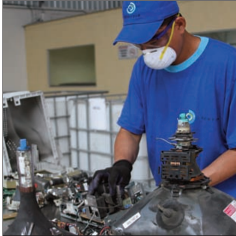
Algunas piezas de los aparatos electrónicos se los reutiliza en nuevos productos.

El Ministerio trabaja en campañas de reciclaje con los funcionarios del sector público para recolectar residuos tecnológicos y así reducir la huella de carbono y ecológica en el país, además, de evitar la contaminación de los espacios de tierra y fuentes de agua.