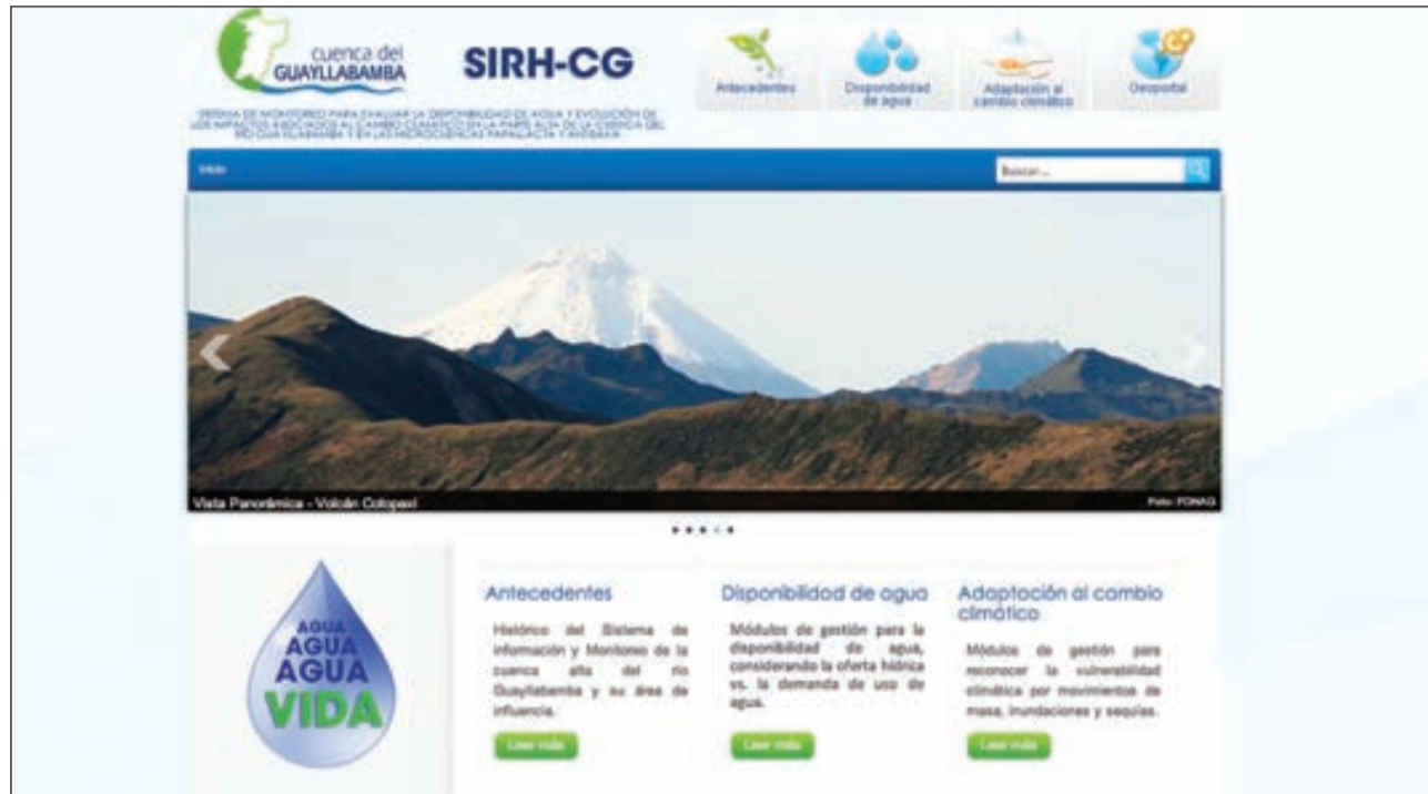
Página principal del sistema de información: www.infoagua-guayllabamba.ec

El Sistema de Información y Monitoreo de recursos hídricos de la cuenca alta del río Guayllabamba y microcuencas Oyacachi, Papallacta y Antisana está renovado.