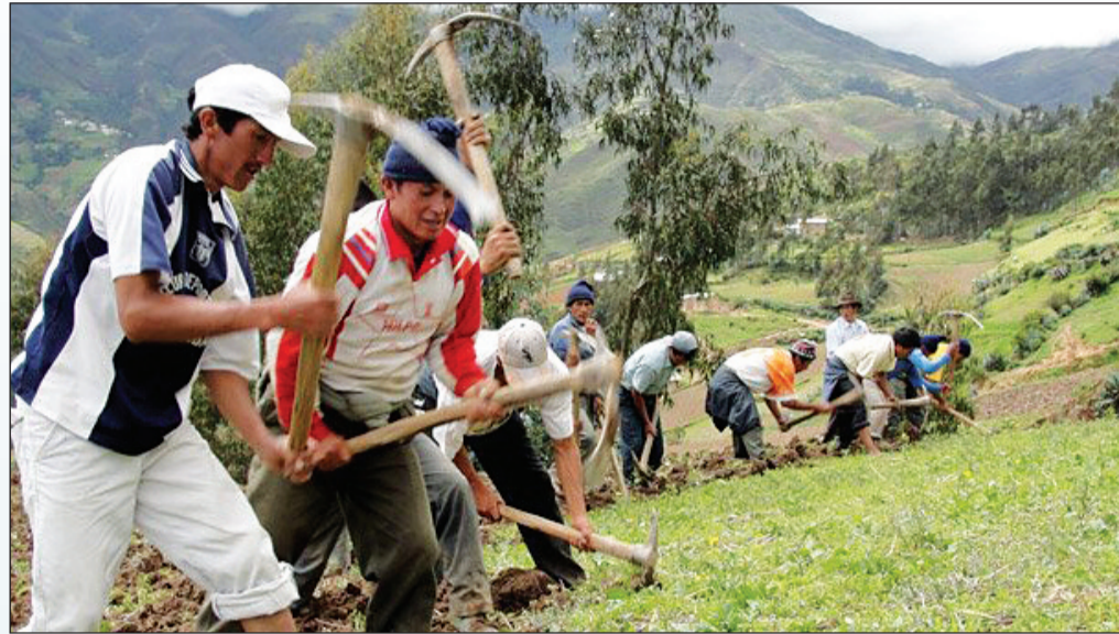
Las comunidades que viven en las zonas montañosas padecen serios problemas de subsistencia.

El desarrollo sostenible y la protección de las regiones de montaña, además del mejoramiento de las condiciones de vida locales, debería ser el núcleo de la legislación en materia de zonas montañosas en las que se