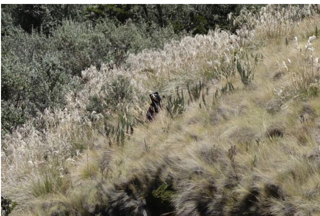
Oso de anteojos en el área de Conservación Hídrica Paluguillo