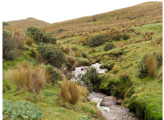
Área de Conservación Hídrica Alto pita