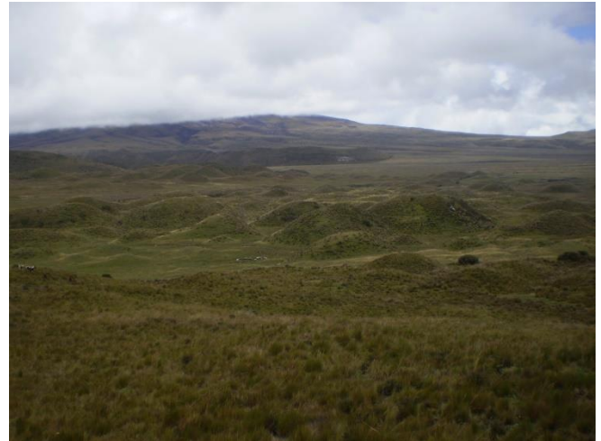
Área de Conservación Hídrica Alto pita

Para facilitar el trabajo de campo de los investigadores en el marco de la Estación Científica, éstos tienen acceso a las instalaciones de hospedaje que se encuentran en los respectivos predios.