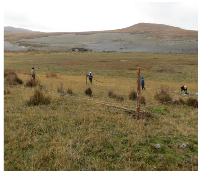
Establecimiento de parcelas experimentales de monitoreo de restauración en el predio Antisana

En la casa hacienda Antisana se pueden alojar hasta 6 investigadores con las mismas facilidades