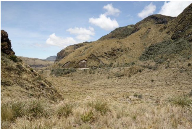
Área de Conservación Hídrica Paluguillo

El acceso desde Quito es a través de la carretera de primer orden Pifo-Papallacta y tarda aproximadamente 1 hora hasta llegar a las instalaciones