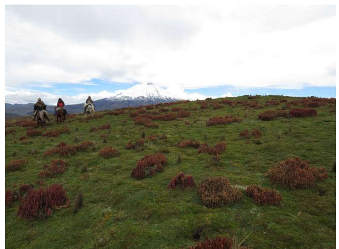
Área de Conservación Hídrica Alto pita