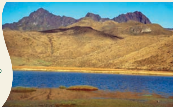
Cuenca del río Pita, fuente de agua para Quito.

El Distrito Metropolitano de Quito es una ciudad en constante crecimiento. Para el año 2050, los abastecimientos actuales de agua para el distrito disminuirán y no habrá suficientes caudales para brindar un servicio adecuado para sus habitantes.