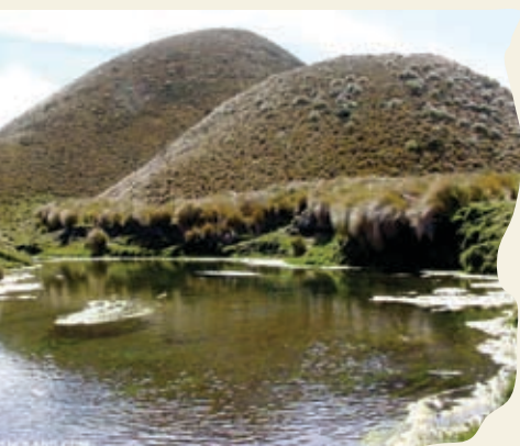
Cuenca del Río Pita

La cuenca alta del Pita, ubicada en las provincias de Pichincha y Cotopaxi, es de mucha importancia ya que abastece de agua a un importante porcentaje del Distrito Metropolitano de Quito y a las poblaciones de: Sangolquí, San Rafael, Loreto, El Pedregal, Gütig, Rumipamba, Selva Alegre, entre otras. También dota de agua para riego y para bebedero a más de cien propiedades dedicadas a la agricultura y ganadería en el sector.