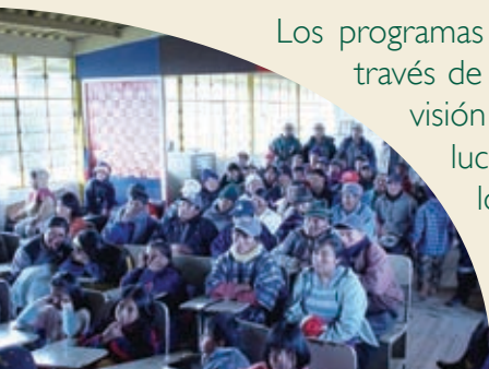
Educación Ambiental en la Cuenca alta del río Pita

Los programas se sustentaron en el respeto cultural y a través de estudios antropológicos, se determinó la visión de desarrollo de los involucrados e involucradas lo que permitió desarrollar modelos accesibles y de fácil comprensión para lograr el objetivo de: sensibilizar y educar en temas ambientales.