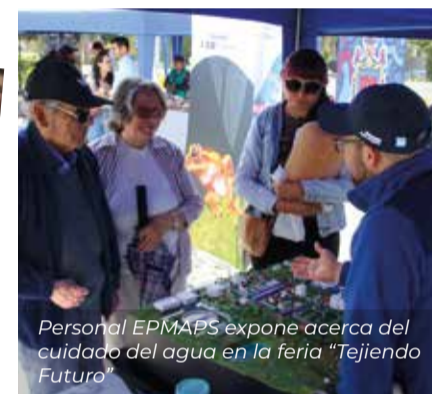
Personal EPMAPS expone acerca del cuidado del agua en la feria “Tejiendo Futuro”