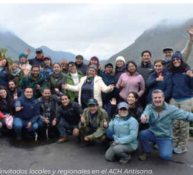
Invitados locales y regionales en el ACH Antisana.