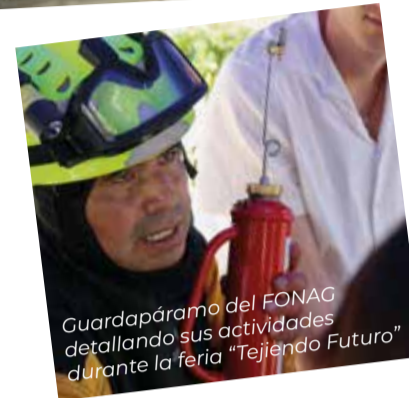
Guardapáramo del FONAG detallando sus actividades durante la feria “Tejiendo Futuro”