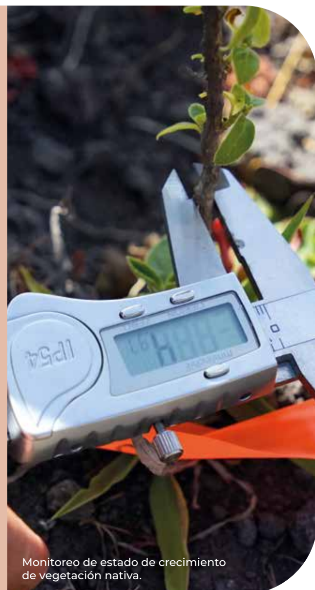
Monitoreo de estado de crecimiento de vegetación nativa.

El FONAG es más que un fondo que permite generar recursos y reinvertirlos en conservación y cuidado del agua; representa un compromiso con la ciudad y una responsabilidad socioambiental, tanto de la municipalidad y la EPMAPS, así como de las entidades constituyentes.