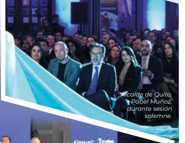
Alcalde de Quito, Pabel Muñoz, durante sesión solemne.