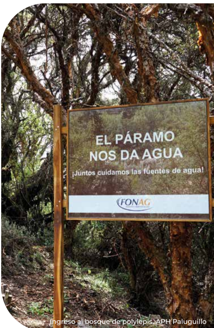
Ingreso al bosque de polylepis, APH Palaguillo

El FONAG se ha constituido en una iniciativa que inspira y guía, no solo en el Ecuador sino en el mundo entero, a una efectiva conservación del recurso hídrico. El FONAG ha hecho que la forma en que se manejan las fuentes de agua que abastecen a la ciudad de Quito sea un modelo de gestión y un espacio de innovación que seguirá aportando para que quienes vivimos en Quito sigamos contando con el recurso más importante para la vida, el agua.