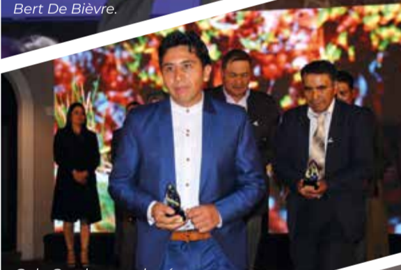
Galo Coral y guardapáramos reciben reconocimiento a la trayectoria.