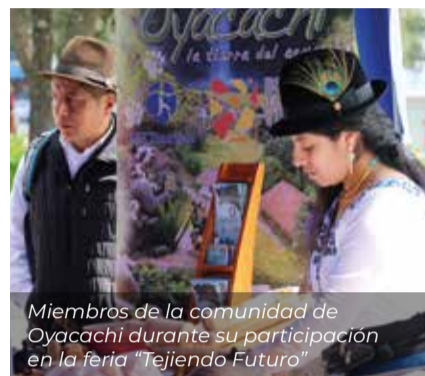
Miembros de la comunidad de Oyacachi durante su participación en la feria “Tejiendo Futuro”