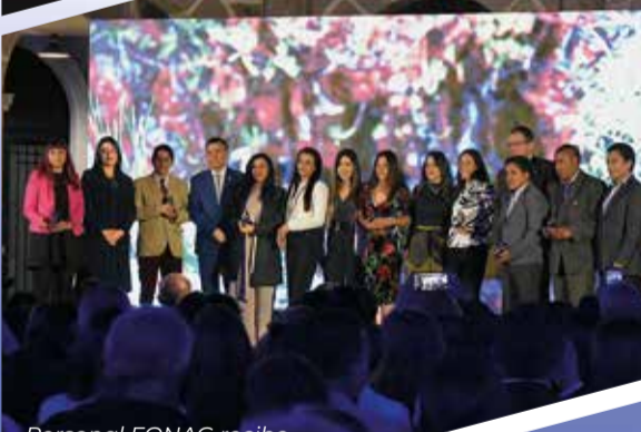
Personal FONAG recibe reconocimiento a la trayectoria.