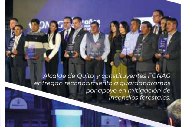
Alcalde de Quito, y constituyentes FONAG entregan reconocimiento a guardapáramos por apoyo en mitigación de incendios forestales.