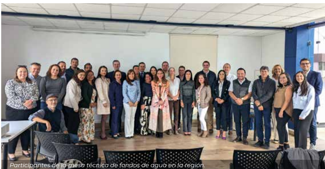
Participantes de la mesa técnica de fondos de agua en la región.