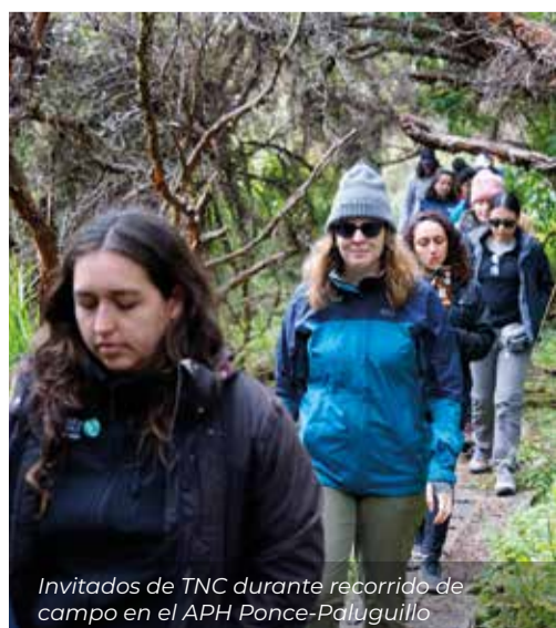
Invitados de TNC durante recorrido de campo en el APH Ponce-Paluguillo